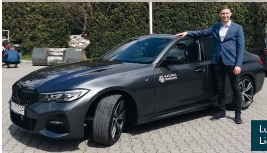
Łukasz Łukasiuk Lider-Menadżer